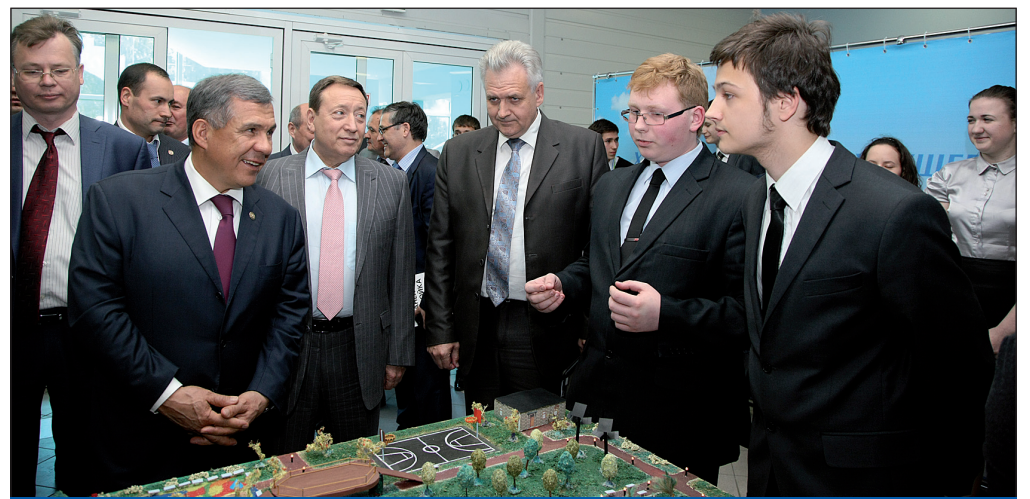
Президент Республики Татарстан посетил выставку, приуроченную ко Дню химика. Презентация проводила победителя Первого республиканского конкурса «Инновационный полигон 2012 «Татарстан – территория будущего» в номинации «Лучший инновационный проект» - «SmartPark-автомобильный парк будущего». Команда учащихся гимназии № 102 им. М.С. Устиновой г.Казани. Организаторами конкурса являются Технополис «Химград» и ФГБОУ ВПО «КНИТУ».

Уже по окончании всех торжеств Президентом Татарстана было принято решение, что отныне День химика всегда будут отмечать в Нижнекамске, так как город является крупным промышленным центром Татарстана, в котором сосредоточены предприятия нефтехимической промышленности.