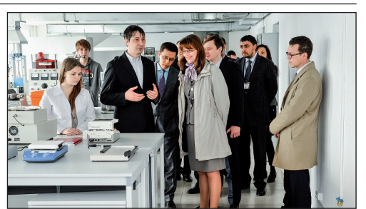
Технополис «Химград», в рамках делового визита в Республику Татарстан, посетила директор Департамента развития малого и среднего предпринимательства Министерства экономического развития Российской Федерации Наталья Ларионова.

В рамках стратегической программы компании озвучили свои инвестиционные проекты до 2030 года; во время параллельно проходящих заседаний поставщики технологий и материалов представили новейшие разработки в области нефтегазопереработки и нефтехимии, востребованные перерабатывающим комплексом РФ. В период проведения форума состоялось подписание соглашений между рядом промышленных компаний.